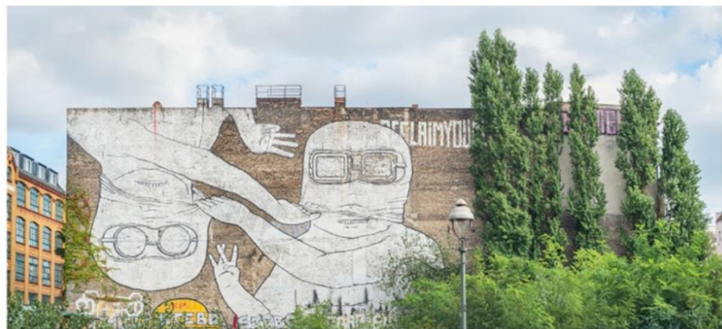
«В 200... районах... Коробки > ... с этим

«Стрит-арт и вообще неформальные уличные изображения сегодня вносят огромный вклад в культуру городского пространства, в формирование атмосферы мест и даже непосредственной материальной ценности мест, — объясняет она. — Так, хорошо изучена взаимосвязь стрит-арта с джентрификацией в крупных европейских городах: творческие сообщества селятся там, где ниже аренда, превращают целые районы Лондона, Парижа и Берлина в галереи под открытым небом, привлекают туристов. А потом за ними в ставший модным район приходят девелоперы, поднимают стоимость жилья, выталкивают и самих художников, и живущие в этих местах сообщества. Это уже осознано как проблема, и на защиту районов встают сами художники, крайне недовольные таким эффектом своих работ. Так, знаменитый стрит-артист Blu, протестуя против джентрификации района Кройцберг, сам уничтожил два своих мурала, вошедших во все путеводители по Берлину.»