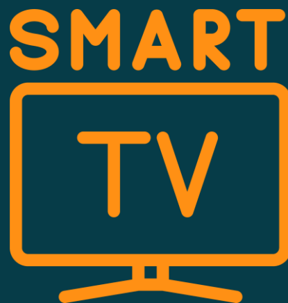
Смарт ТВ, IVI