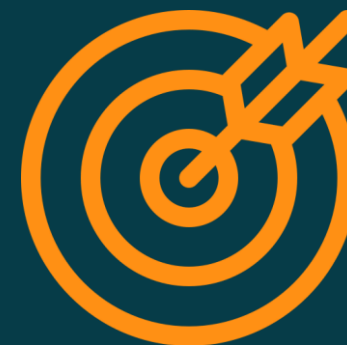
Таргетинги на аудиторию