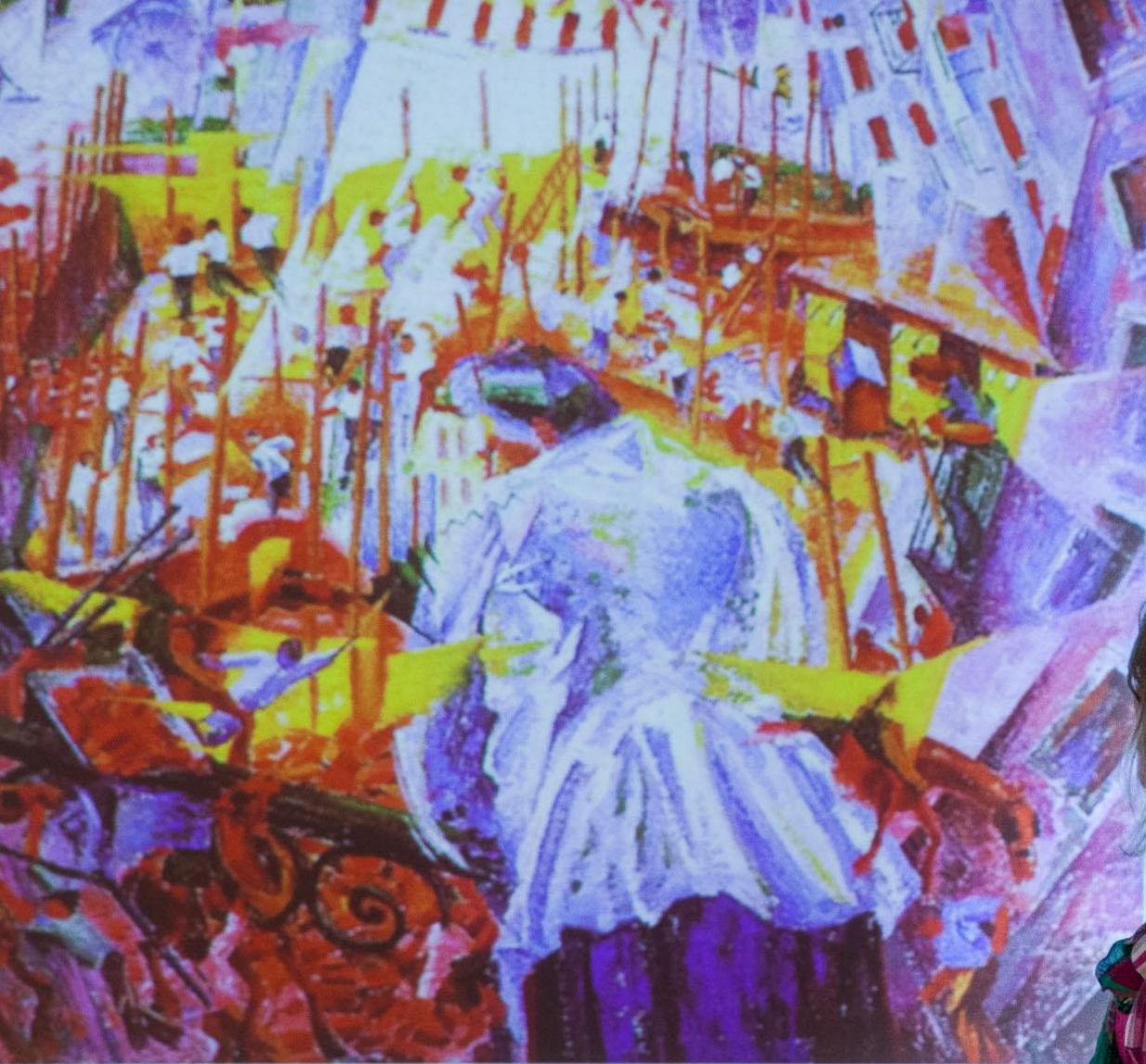
Умберто Боччони «Город встает» 1911