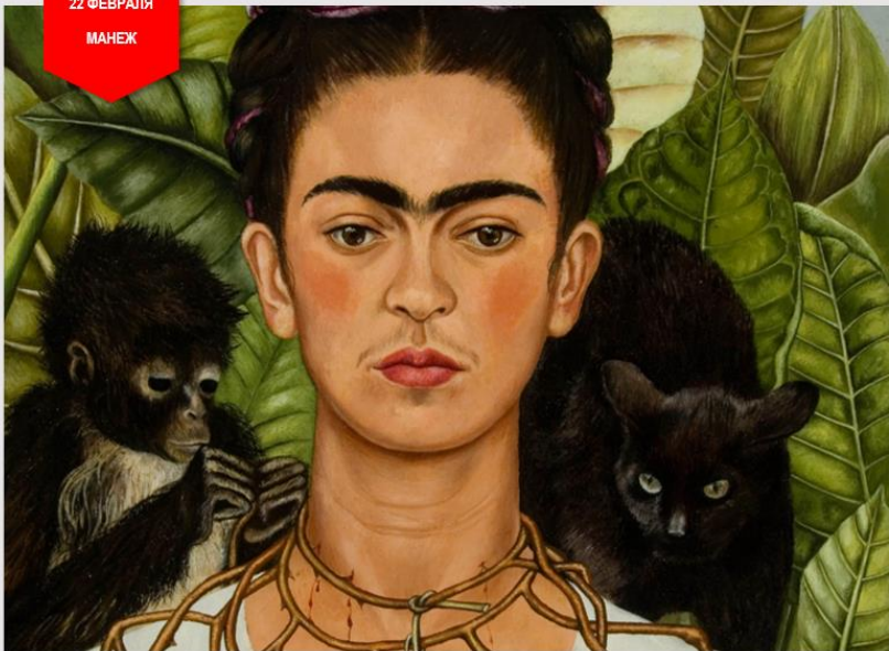
VIVA LA VIDA. ФРИДА КАЛО И ДИЕГО РИВЕРА