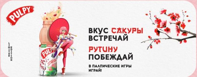
АНОНСИРОВАНИЕ ИГРЫ И НОВОГО ПРОДУКТА В КОНТАКТЕ