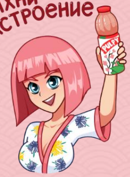
ПАЛПИЧЕСКИЕ АНИМЕ СТИКЕРЫ В КОНТАКТЕ