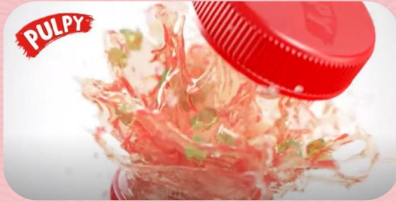
ОХВАТНАЯ ПОДДЕРЖКА В ДИДЖИТАЛ