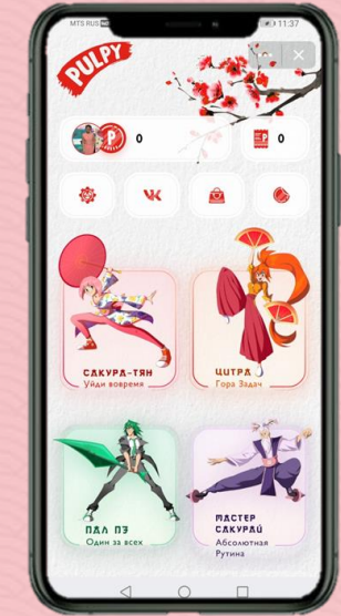
PULPY VK MINI APP