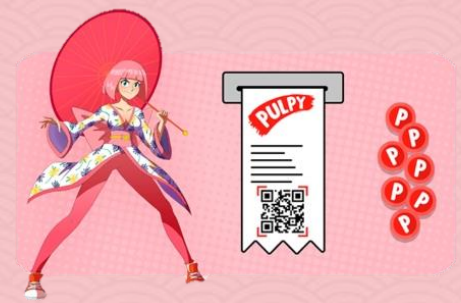
СКАНИРОВАНИЕ ЧЕКА В ЧАТ-БОТЕ В КОНТАКТЕ И КОНКУРС С ПРИЗАМИ